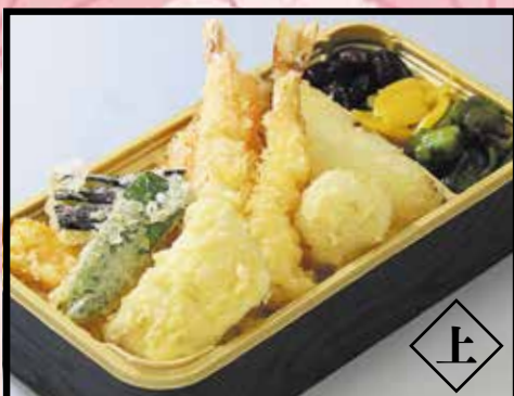
天 井 汁物付 1,350円 (1,458円 (税込))

※上記のお弁当以外にもご予算に応じます。 ※写真はイメージ。仕入れの状況により内容が変わる場合がございます。