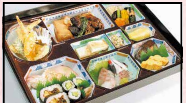
折詰・懐石弁当 汁物付 4,500円 (4,860円 (税込))

※上記のお弁当以外にもご予算に応じます。 ※写真はイメージ。仕入れの状況により内容が変わる場合がございます。