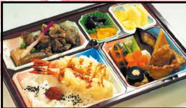
折詰・懐石弁当 汁物付 2,500円 (2,700円 (税込))