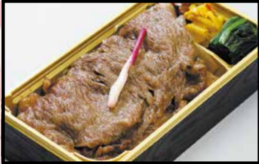
伊万里牛サーロインまるごと1枚弁当 汁物付 2,800円 (3,024円 (税込))