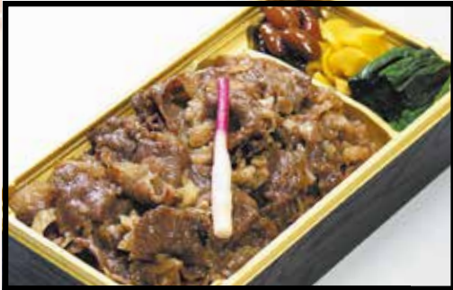
佐賀牛A5カルビ牛めし 汁物付 1,600円 (1,728円 (税込))