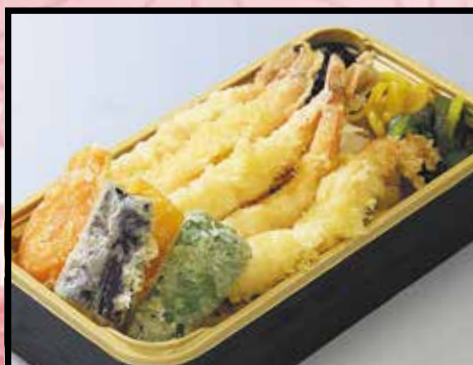
海老天 汁物付 1,600円 (1,728円 (税込))