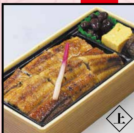
うな重 4,500円 (4,860円 (税込))