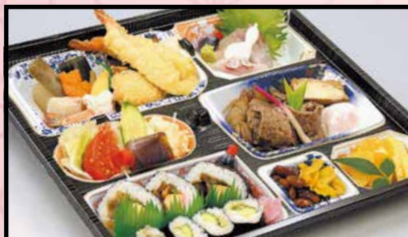
折詰・懐石弁当 汁物付 3,500円 (3,780円 (税込))