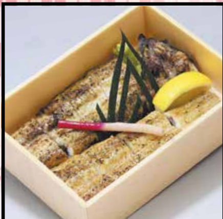
うなぎ白焼き 4,000円 (4,320円 (税込))