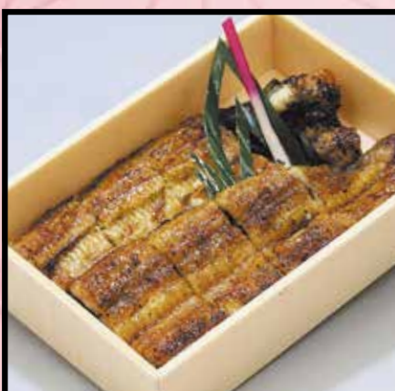
うなぎ蒲焼 4,200円 (4,536円 (税込))